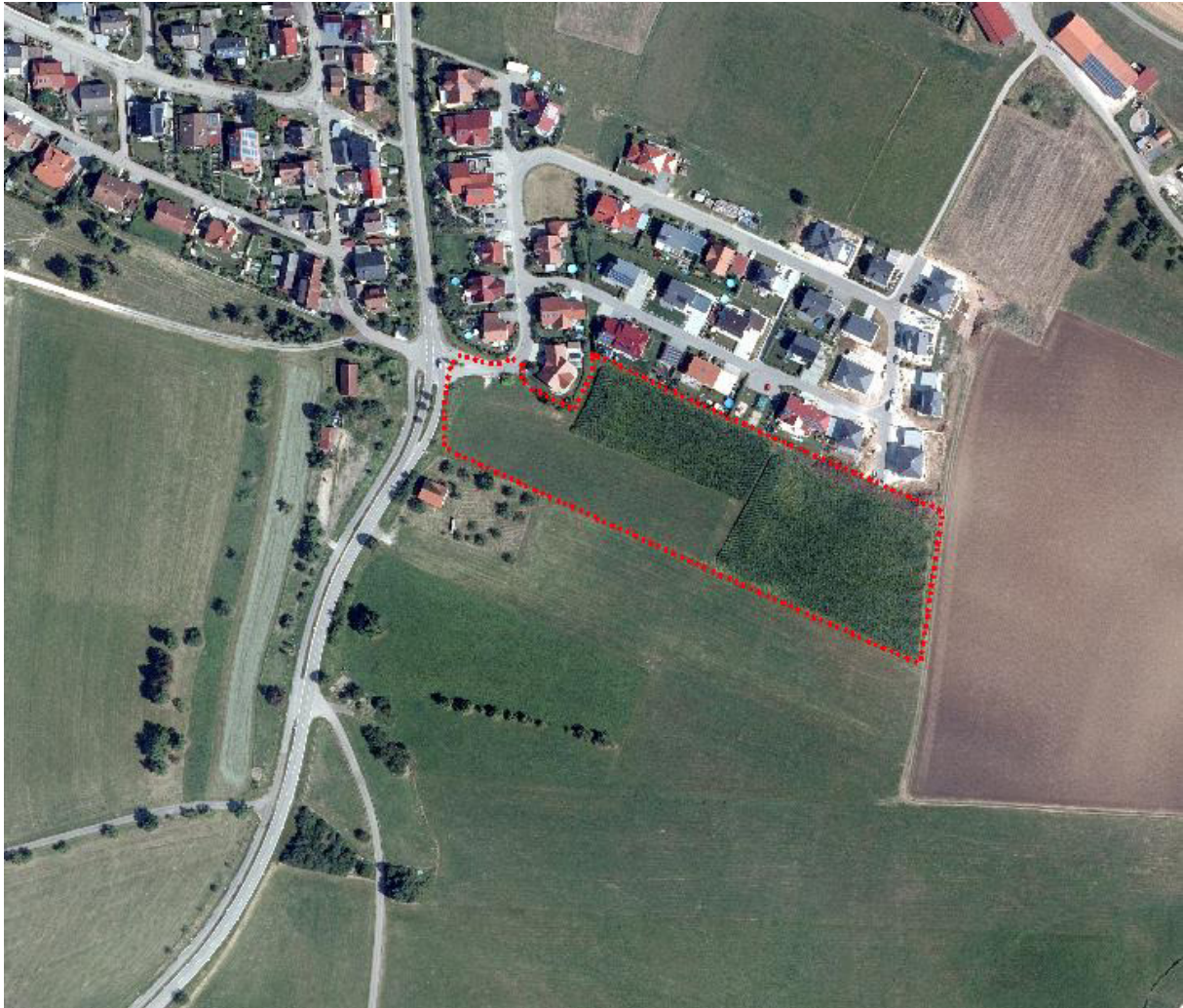
Abbildung 1: Luftbild vom Plangebiet; Umgriff = rot gestrichelt