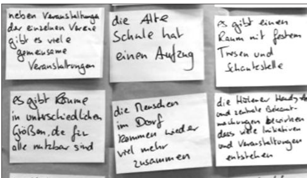
Einige der Visionen und Wünsche, die bis Ende 2019 durch die Initiative für Hülen erreicht werden soll

In den Augen der Hülener könnte dies gemeinsam mit einer Informationsplattform im Internet oder auf einer simplen Infotafel zu einem noch reicheren Dorfleben führen, in dem die Vereine mehr zusammenarbeiten, Alt- und Neubürger und alle Altersgruppen mehr zusammenkommen, man sich „konstruktiv, aber offen streitet“ und Meinungen austauscht und auch die gegenseitige Unterstützung und Hilfe gefördert wird.